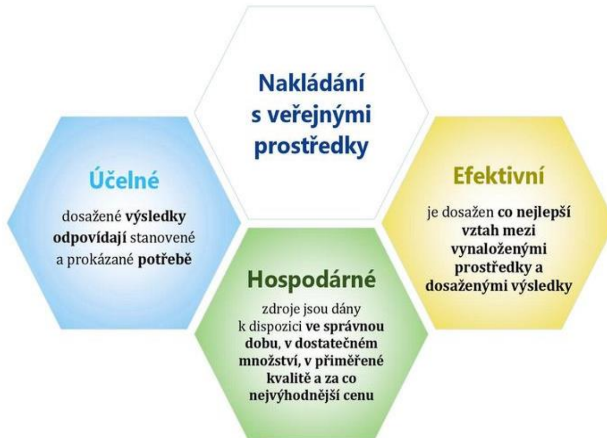
Obrázek 2 Principy 3E