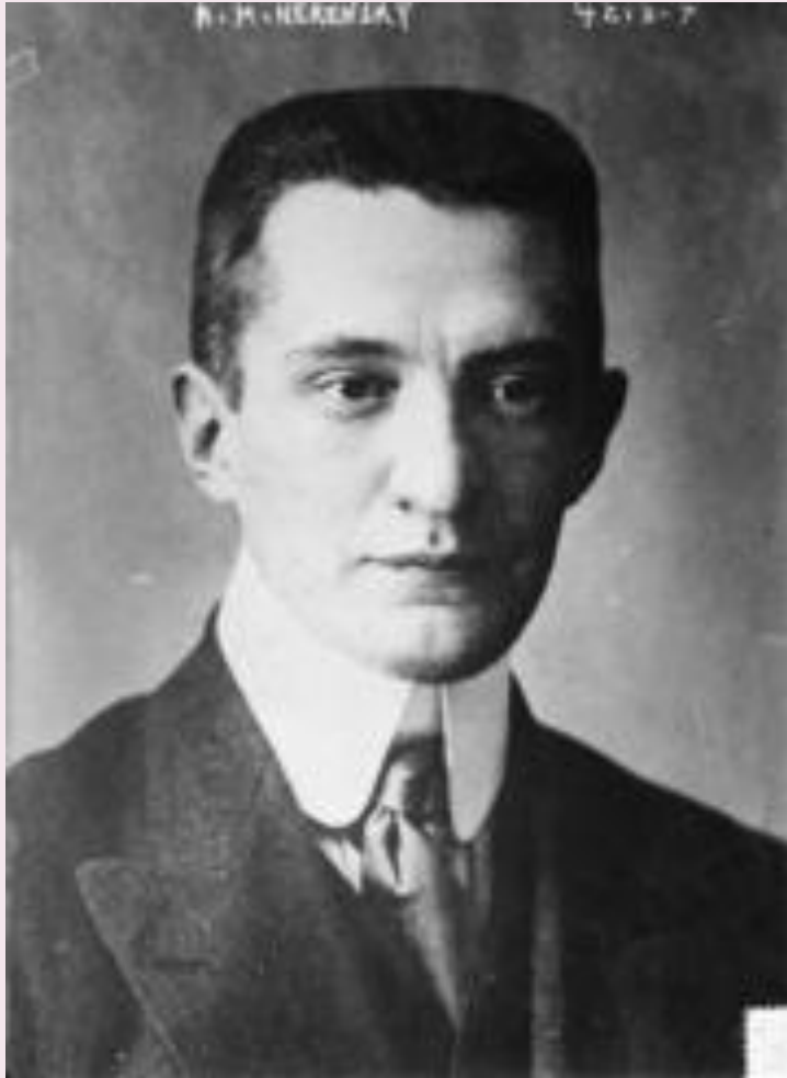
Alexander F. Kerenskiy 1881-1970