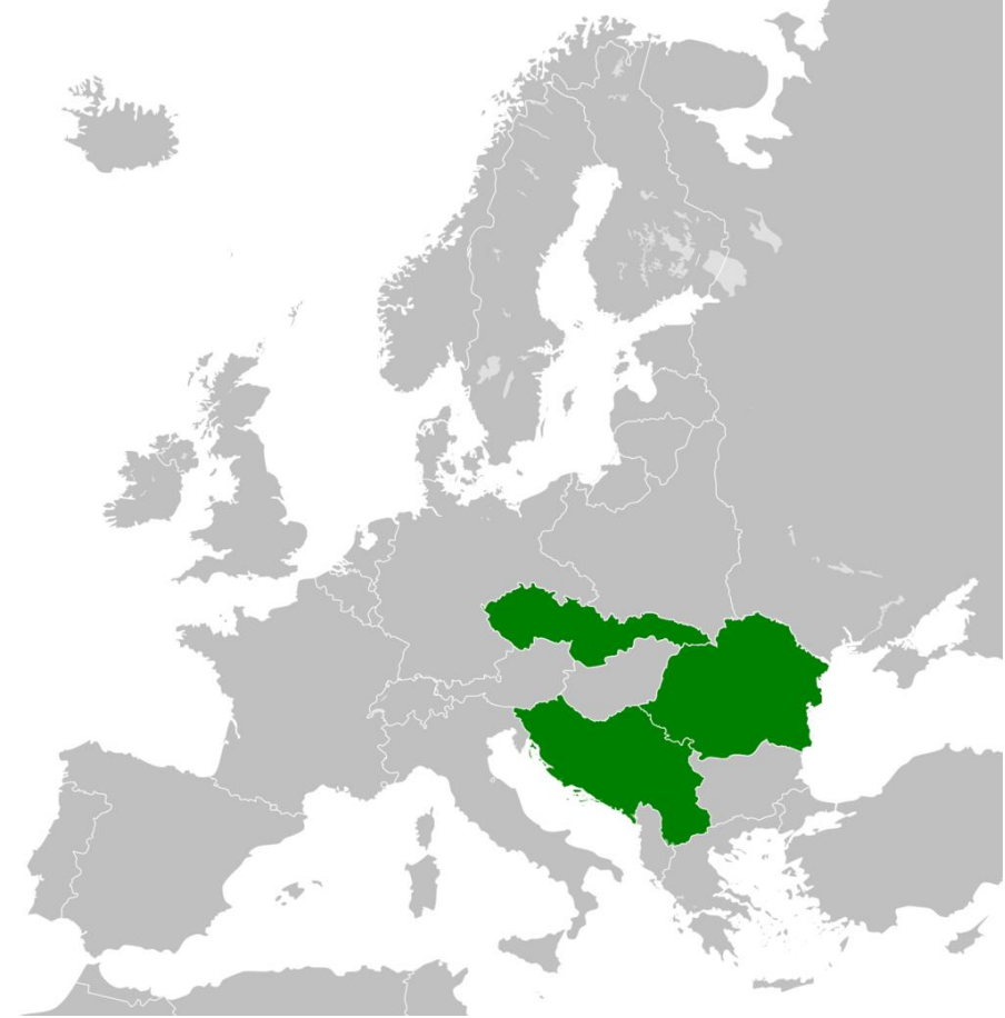
Mapa zobrazující členské státy Malé dohody (Petite Entente). [20. 9. 2018]

Pod Dohodovým dubem se scházeli také „pátečníci“