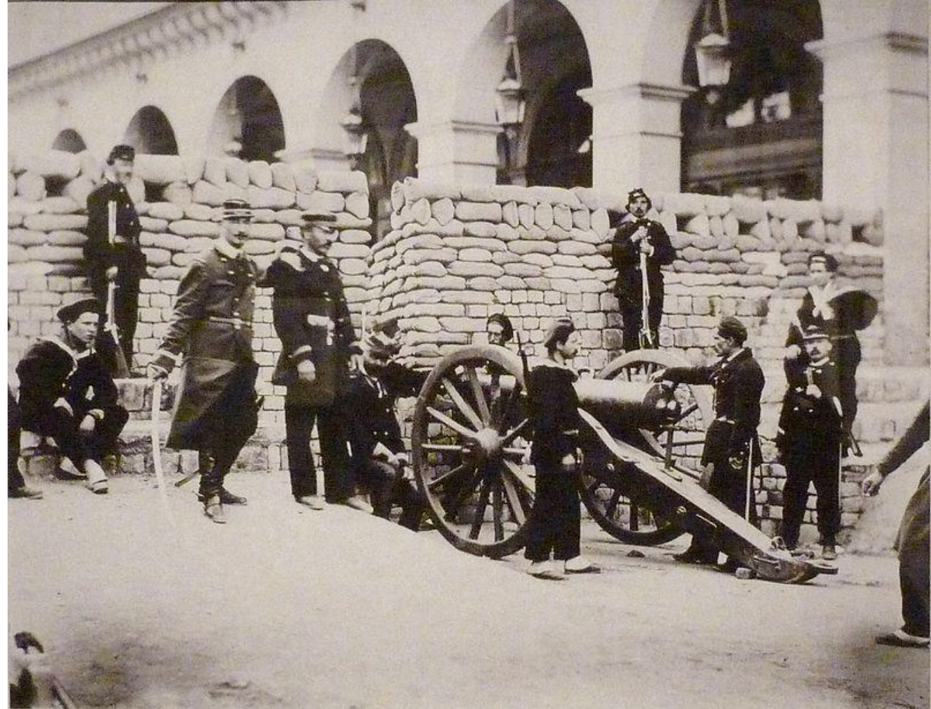
Pařížská komuna. Národní gardy u barikády.

https://www.crg.cz/sekce/historie/referaty/19-stoleti/parizska_komuna.htm [12. 9. 2018]