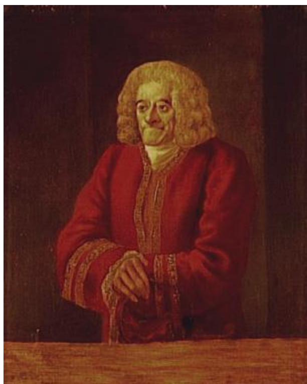
Obrázek 2 Voltaire (1694–1778) ve starším věku

Vztahy mezi státy jako politickými subjekty se zrodily v situaci, kdy postupně došlo k pádu doktríny universalismu – tedy křesťanské jednoty a pospolitosti jednotlivých panovníků a států. Univerzalismus přestal fungovat v momentě, kdy se západní křesťanství začalo štěpit na katolické a protestantské, církev již nebyla jednotná. Náhradou tohoto systému se postupně měla stát kolektivní identita „evropanství“. Jedním z prvních průkopníků této myšlenky se stal v roce 1751 Voltaire , který konstatoval následující tezi: „ Je to jakási velká republika rozdělená do několika států, všechny jsou ve vzájemném styku. Všechny mají stejný