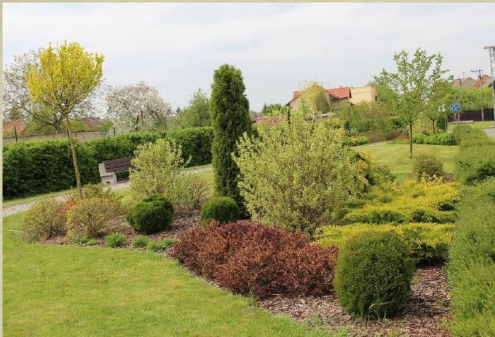
Výsadba v centru obce Polkovice (2010)